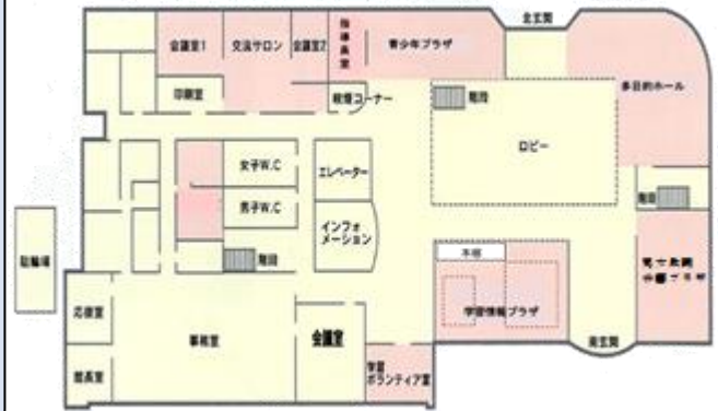
生涯学習センター 1階